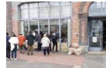
北彩都地域ごみゼロ大作戦

「45」は、パリオリンピックでの日本代表選手が獲得したメダル数。「65m80 (夢では 70m)」、これもパリオリンピックでの数字。女子槍投げの北口榛花選手の金メダルの記録です。「名言が残せなかった」という印象的な言葉もありました。