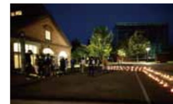
キャンドルナイト in 旭川

「54-59」は大リーグの大谷翔平選手の本塁打数と盗塁数です。史上初の「50-50」達成、2 年連続 MVP 獲得と大活躍でした。