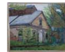
「平成 16 年夏」